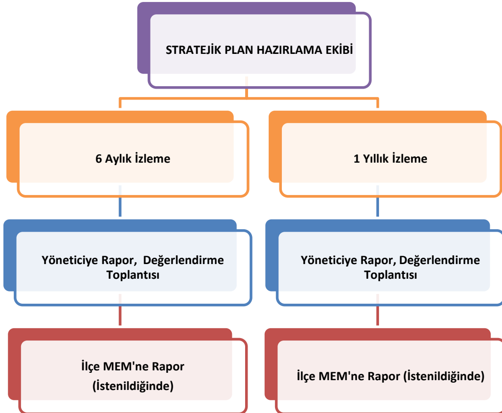
Şekil 2 İzleme ve Değerlendirme Süreci

Müdürlüğümüzün 2019-2023 Stratejik Planı İzleme ve Değerlendirme sürecini ifade eden İzleme ve Değerlendirme Modeli hazırlanmıştır. Okulumuzun Stratejik Plan İzleme-Değerlendirme çalışmaları eğitim-öğretim yılı çalışma takvimi de dikkate alınarak 6 aylık ve 1 yıllık sürelerde gerçekleştirilecektir. 6 aylık sürelerde Okul Müdürüne rapor hazırlanacak ve değerlendirme toplantısı düzenlenecektir. İzleme-değerlendirme raporu, istenildiğinde İlçe Milli Eğitim Müdürlüğüne gönderilecektir.